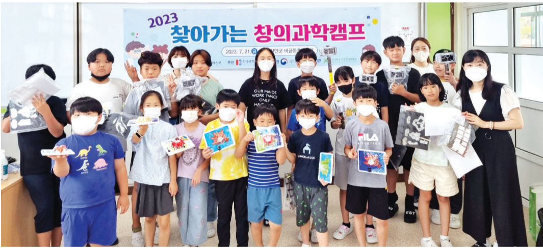
국립목포대학교(총장 송하철) 과학영재교육원은 최근 신안 비금동초등학교에서 ‘찾아가는 창의과학캠프’ 프로그램을 운영했다.