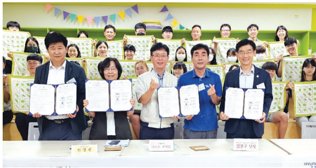
광주교육시민협치진흥원설립추진단이 최근 현대위아, 월곡중학교와 학교숲 조성 및 생태교육 지원을 위한 업무협약을 체결했다.