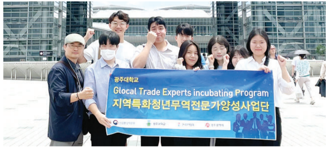
광주대학교(총장 김동진) 지역특화무역전문기양성사업단은 최근 일본 최대 규모 종합 소비재 전시회인 '라이프스타일 워크 도표'에 참가했다.