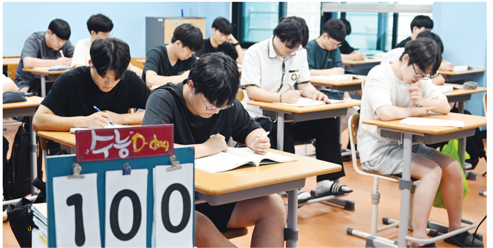
광주시 동구 광주고등학교 3학년 학생들이 7일 2024학년도 대학수능능력시험(수능)을 앞두고 교실에서 공부에 열중하고 있다.