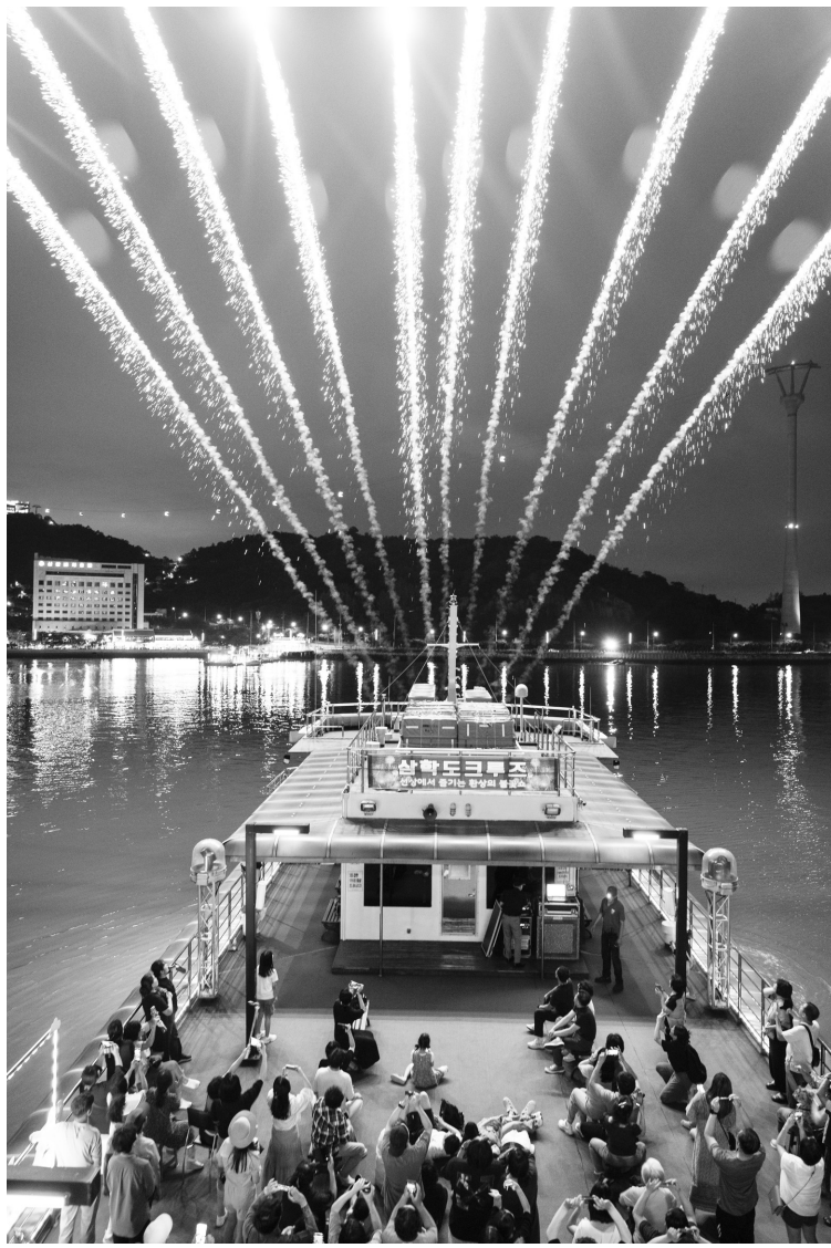
삼학도 해상 크루즈 불꽃투어

해상 무대 뮤지컬과 함께 팝페라·퍼포먼스 공연, 초대형 불꽃놀이 등이 어우러진다. 목포시는 올해 기존 두 작품을 리뉴얼하고 세 개의 새로운 장르의 뮤지컬을 선보이는 등 총 5개의 완성도 높은 해상무대 뮤지컬을 준비했다. 이와 함께 화려하고 웅장한 불꽃쇼로 목포 평화광장 하늘을 수놓는다. 젊은 세대를 위한 희망불꽃 이벤트와 프라포즈 이벤트도 마련돼 호응을 얻고 있다.