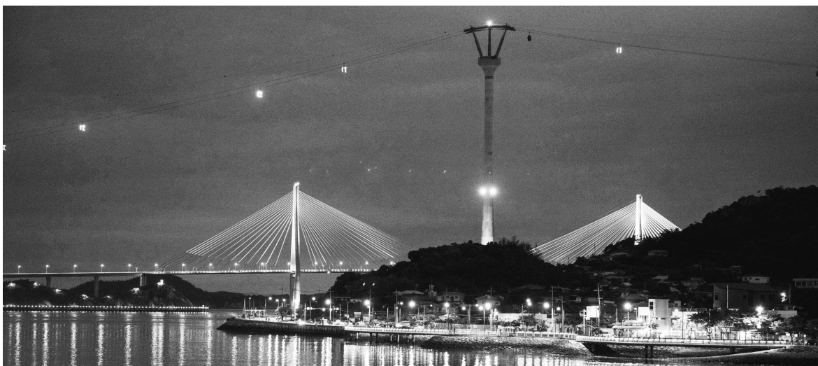
목포 야경 투어

/글=송기동 기자 song@kwangju.co.kr