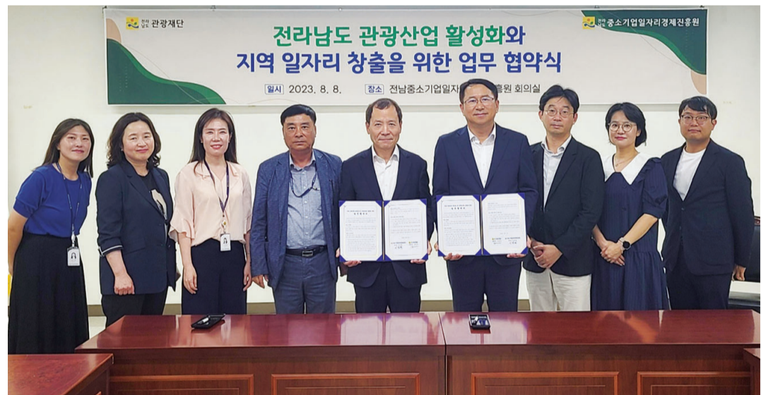
전남관광재단과 전남중소기업일자리경제진흥원이 8일 전남의 신성장 동력인 관광산업 일자리 창출 및 지역기업 성장을 위한 협약을 체결했다. 양 기관은 ‘관광기업 잡 매칭데이’ 행사를 공동으로 개최하고 관광일자리 박람회 등을 통해 구직자들에게 취업 기회를 제공할 예정이다.