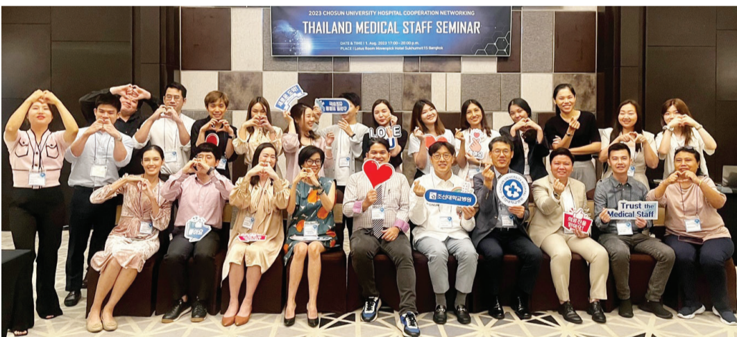
조선대병원(병원장 김경중)은 최근 해외협력 네트워크 구축 일환으로 동남아시아 최대 종합병원인 태국 범룽랏 국제병원을 방문했다.