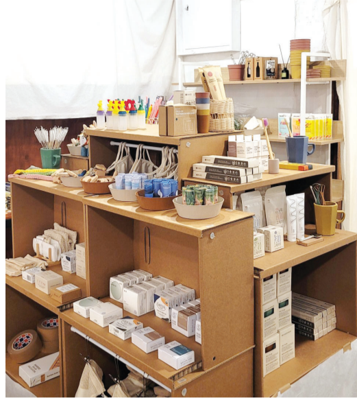
제로웨이스트 카페 ‘몽몽만남’ 내부 모습.

이들이 함께 운영하는 ‘몽몽만남(광주광역시 동구 경양로 374)’은 기후 위기 시대에 플라스틱 사용을 줄이고 제로웨이스트를 실천하는 친환경 공간이다. 테이크아웃 잔 대신 기부 받은 텀블러에 음료를 담아 손님이 가져갈 수 있도록 하고, 고체세제 등 생활용품들을 직접 담아 가는 리필스테이션도 마련했다. “저 혼자라면 엄두를 못 냈을 텐데 같이 마음이 맞는 데 시작할 수 있었어요.” 그가 공간을 선보이기 전까지는 많은 고민과 용기가 필요했다. 제로웨이스트 카페를 운영하기 전 국제기후환경센터에서 일했던 김 씨는 시민들이 좀