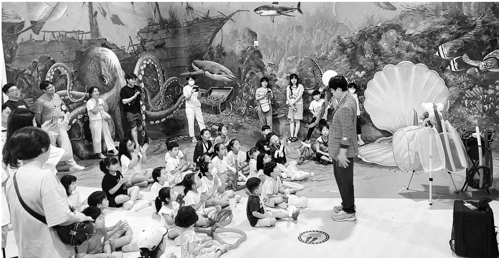
정읍 천사히어로즈에서 풍선공연을 관람하는 아이들.