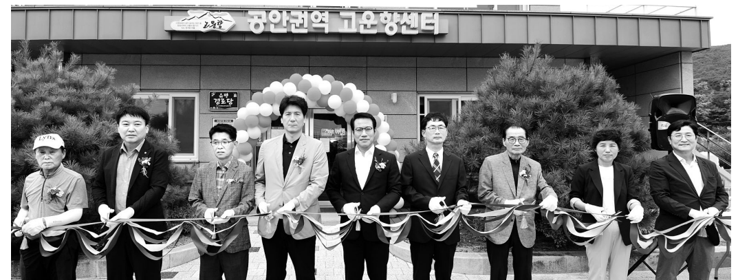
최경식(가운데) 남원시장과 관계자들이 지난 18일 공안권역 고운향센터에서 '경로당 시정홍보 와이파 이 개통'을 축하하며 테이프커팅을 하고 있다.

남원시가 경로당 시정홍보 와이파이 구축을 완 료하고 본격적인 시정홍보를 추진하고 있다.