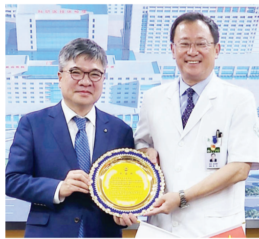
동한 상호간 글로벌 경쟁력 강화를 위해 노력하겠다”고 밝혔다.