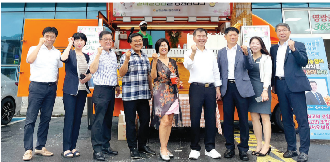
NH농협손해보험 전남총국은 23일 굴비골농협의 '더블업(Double-up) 프로모션' 1위 달성을 기념해 조합원들과 내방고객에게 커피 무료제공 이벤트를 실시했다.