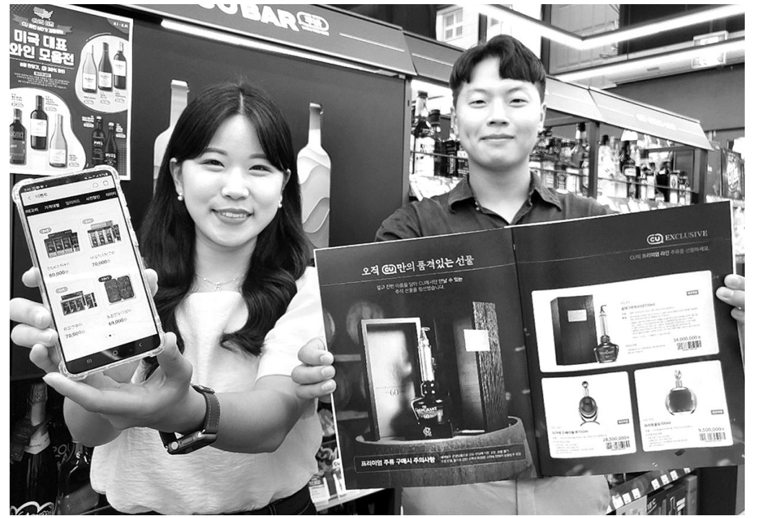
CU 모델들이 추석 선물 세트를 선보이고 있다.

세븐일레븐은 엔데믹 이후 국내외 여행이 급증하는 점을 고려해 노랑풍선과 함께 다양한 여행 상품을 내놓는다. 세븐일레븐 매장에서 할인 코드를 구매하면 노랑풍선 사이트에서 여행 상품을 추가 할인받을 수 있다. 순금 열쇠와 골드바, 프랑스 희귀 와인, 명품 브랜드 가방 등 이색 상품과 벤츠, BMW 등 수입차 구매나 장기렌트 상품도 선보인다. MZ세대를 겨냥한 하이패 패키지과 캐릭터 상품도 준비돼있다. 이마트24는 까사미아 우스터 리클라이너와 안마의자, 로보청소기 등 생활가전 상품과 반려동물 전용 정수기, 카시트 등을 선보인다. 노래방 기기 전문업체 TJ와 함께 가정용 방음 노래방 박스도 이색 상품으로 준비했다. 연휴 기간 캠핑을 떠나는 고객을 위해 캠핑용품 대여 서비스를 내놓고 프리미엄 정육 선물 세트와 MZ세대 입맛을 고려한 전통 디저트도 다양하게 출시한다. /김민석 기자 mskim@kwangju.co.kr·연합뉴스