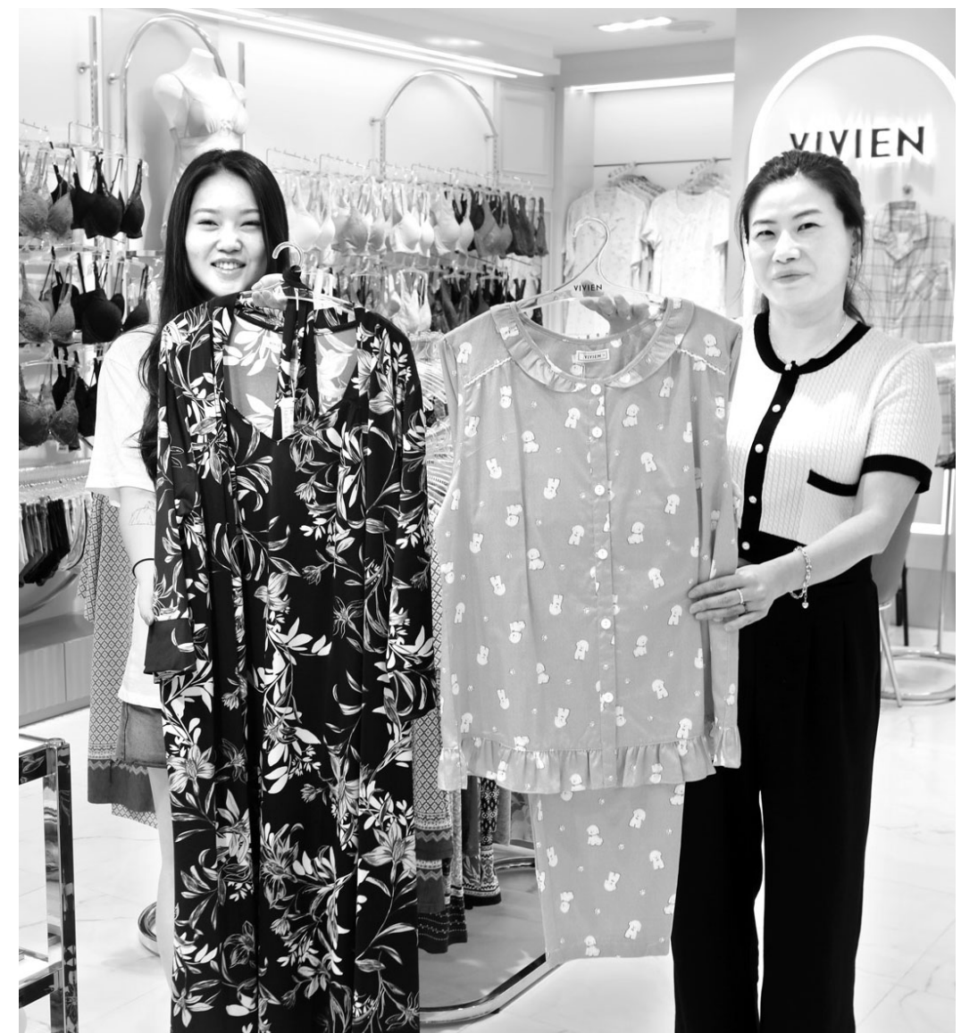
"비비안" 할인전 초대합니다" 롯데백화점 광주점 9층 여성속옷 브랜드 '비비안' 직원들이 여성 홈웨어 상품을 선보이고 있다. 비비안은 오는 9월 1일부터 7일까지 품목별로 최대 80% 할인 판매하는 '비비안 브랜드 초대전'을 진행한다. 광주점은 구매 금액대별로 5%의 롯데상품권을 증정하는 사은행사도 진행한다.

지난해 추석에 비해 20% 늘렸다. 이밖에 롯데백화점은 동반성장위원회와 함께 2021년부터 운영 중인 'ESG(환경·사회·지배구조) 경영 지원 프로그램' 사업을 확대할 예정이다. 다음 달 참여사를 모집·선발해 내년 상반기까지 ESG 컨설팅 프로그램을 제공한다. 정준호 롯데백화점 대표는 "파트너사와의 동반 성장을 위해 일회성 지원이 아닌 실질적인 혜택을 주고자 힘쓰고 있다"고 말했다. /김민석 기자 mskim@kwangju.co.kr