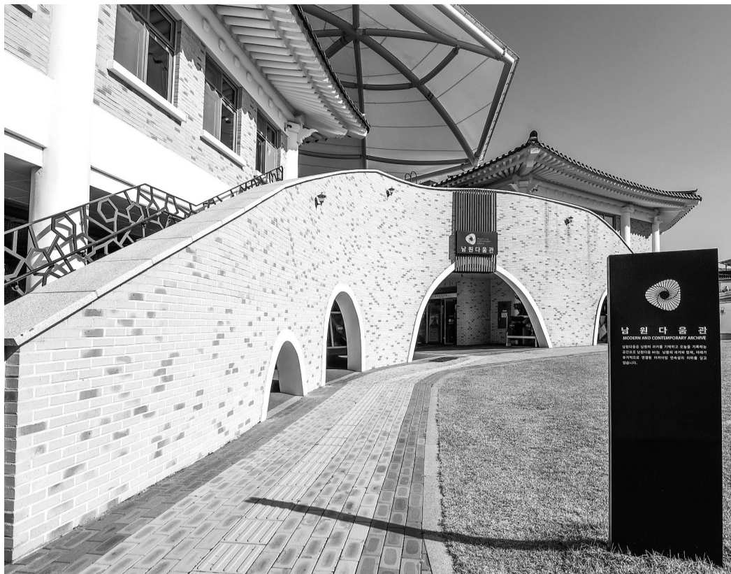
남원의 과거와 오늘을 인공지능(AI)으로 기록·구축할 남원다움관 전경.

남원시가 과거와 현재를 아우르는 남원의 다양한 모습을 인공지능(AI) 데이터로 기록한다. 남원시는 과학기술정보통신부 산하 한국지능정보사회진흥원이 주관하는 ‘2023년도 인공지능 학습용 데이터 구축사업’의 수요기관으로 선정됐다고 3일 밝혔다. 이 사업은 정부 차원에서 인공지능 데이터를 구축하고 다양하게 활용되는 디지털 플랫폼을 구축해 인공지능 산업을 활성화하기 위한 것이 목적이다. 서울과학기술대학교 산학협력단이 주관해 유클리트소프트, 엠에이치소프트, 써로마인드 등 정보 기술(IT)기업들이 남원시와 함께 컨소시엄을 구성해 참여한다. 남원시가 이 사업에 참여해 혜택을 보게 된 것은 남원의 모습을 AI데이터로 기록하고자 한 시의 연구과제가 공모주제로 선정됐기 때문이다. 이에 따라 시는 예산 17억원이 투입되는 ‘인공지능 학습용 데이터 구축사업’의 성과물을 지원받아 메타데이터가 적용된 대량의 AI데이터를 구축하게 된다. 남원에서의 시범적 사업이 완료된 이후엔 범정부적 플랫폼에 적용하는 것이 사업의 최종 목표