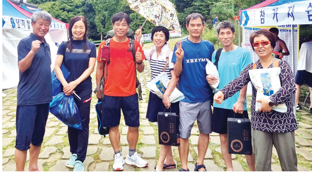
지난 2일 경상힐링클럽 회원들이 화순군 화순읍 너릿재에서 열린 '제8회 화순 너릿재 옛길 마라톤 대회'에서 완주한 뒤 포즈를 취하고 있다.

한편 클럽은 경상국립대학교 평생교육원에서 ‘힐링 마라톤 배우기’ 강의를 수강한 소수의 회원들을 중심으로 만들어졌고, 매년 경상대 평생교육원에서 마라톤 강의를 수강한 수료생들이 한 명씩 추가되면서 지금은 58명의 회원이 소속돼 있다. 지금도 경상대 평생교육원의 마라톤 강의를 3개월 이상 수료해야만 회원으로 가입할 수 있다.