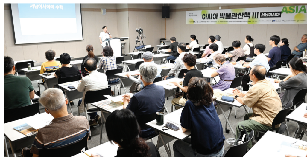
‘아시아 박물관 산책Ⅲ 서남아시아’ 강좌가 지난 6일 아시아문화전당 아시아문화박물관 문화교육실에서 열렸다.