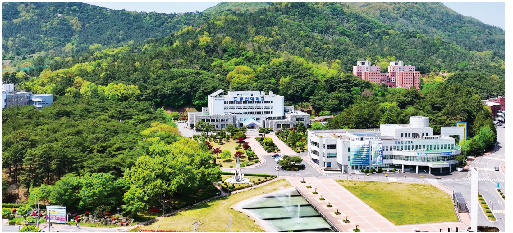
디지털 대전환 시대에 걸맞은 인재양성에 나선 동신대학교가 컴퓨터·응급구조·국제한국어학과를 신설하는 등 대학 경쟁력 강화에 나서고 있다. 사진은 동신대 캠퍼스 전경.

응급구조학과는 전남지역 대학 중 유일하게 4년제 학부 교육체제를 갖췄다. 지도교수와 상담을 통해 구체적인 진로 분야를 설정하고 보건복지부의 응급구조사 1급 자격증을 물론 미국심장협회, 대한심폐소생협회의 기본소생술, 전문심장소생술, 전