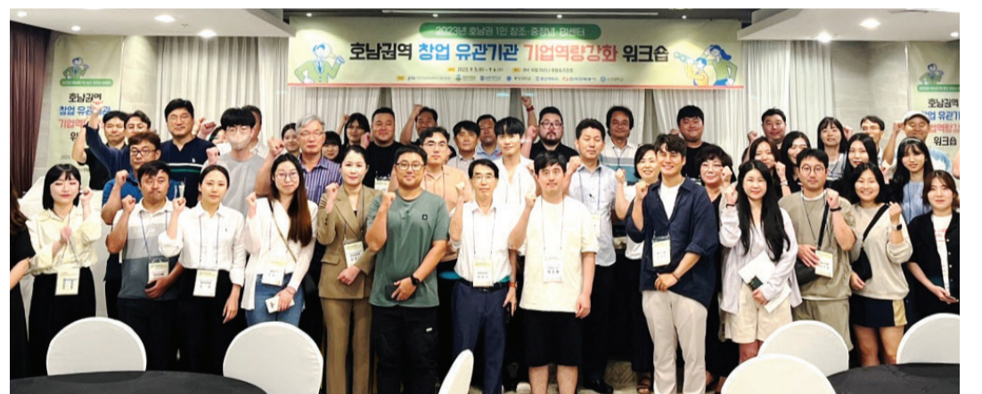
동강대 창업보육센터가 최근 호남권 1인 창조·중장년·BI센터 입주기업 100여 명이 참석한 가운데 '2023년 하반기 호남권역 창업유망기관 기업역량강화 워크숍'을 열었다.

㈜디알큐어는 2007년부터 공동연구를 시작해, 2019년 혁신형 의사과학자 정부과제를 수행하면서 방사선 치료보조제 개발에 나서고 있다. /윤영기 기자 penfoot@