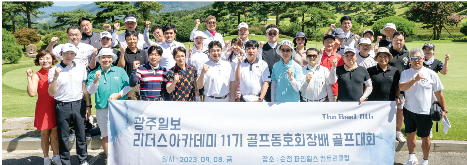
2023 광주일보 리더스 아카데미 11기 골프동호회 회장배 골프대회가 지난 8일 순천 파인힐스 컨트리클럽에서 열렸다.

11기 원우회는 골프대회를 마치고 파인힐스 CC 연회장으로 자리를 옮겨 저녁 만찬을 즐겼다.