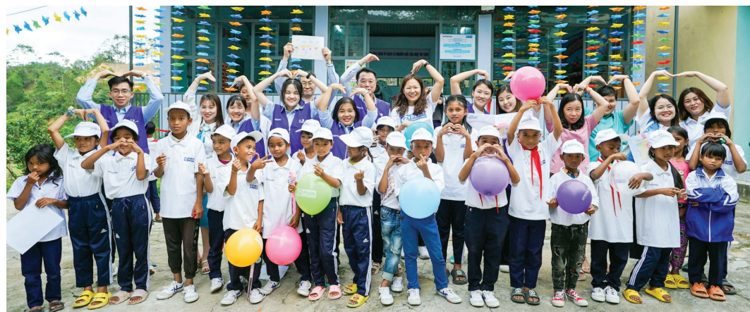
활동인 ‘베트남 미소원정대’를 파견해 매년 1000여 명 이상의 주민을 치료하고 있다. 또 베트남 중부 광남성 산악지대 유치원 건설, 미혼모 자립을 위한

효성은 2018년부터 국제구조개발 NGO인 플랜 코리아와 함께 ‘베트남 소외지역 아동 지원 사업’을 위한 협약을 맺고, 베트남 저개발 지역 아동과 지역 사회에 대한 후원을 진행하고 있다. 2018년부터 효성과 효성 임직원들의 후원금으로 총 1191명의 베트남 학생의 교육과 생활 환경 개선에 기여했다. 한편 효성은 지난 2011년부터 베트남 무료 진료