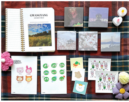
광양여중 B.C.L이 만든 ‘광양 굿즈 문구세트’.

굿즈 문구세트’를 9900원에 판매중이다. 광양 매실과 동물 캐릭터들은 학생들이 직접 디자인해 만들었고 명소 사진은 작가에게 사용을 허락받아 상품으로 개발했다. “우리 지역을 알고 싶다’는 생각에 지역 명소와 명물을 담은 문구류를 제작하게 됐죠. 직접 기획한 제품으로 수익을 창출하고 지역사회에도 기여할 수 있으니 일석이조라고 생각합니다.”(회장 이지혜)