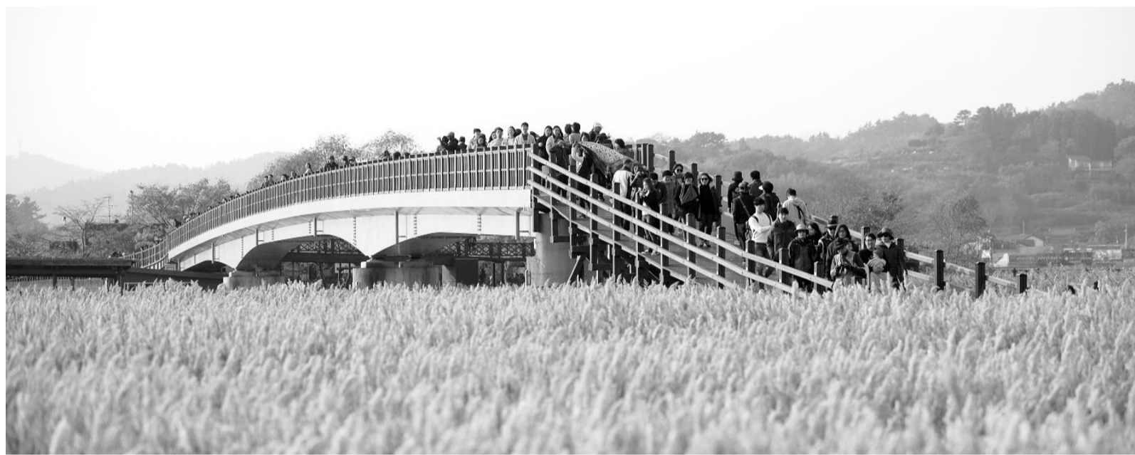
2023순천만국제정원박람회가 열리는 국가정원과 순천만습지 등이 가을 단장을 마쳤다. 갈대밭이 넓게 펼쳐진 순천만습지.

여주시가 배달노동자에게 안전용품 구매비 10만원을 지원한다. 여주시 배달노동자 안전용품 구매비 지원사업은 고용노동부와 여주시노사민정협의회가 함께 추진한다. 배달노동자들은 여주시가 진행하는 안전교육을 받고 안전용품을 구매한 뒤 증빙 자료를 내면 1인당 최고 10만원을 지원받을 수 있다. 안전용품은 안전모와 블랙박스(주행 기록 장치), 안전화 등이 있다. 여주시는 배달대행업체 소속 배달기사와 직접 배달하는 사업자, 사업장 소속 배달 업무 종사자 등 모두 230명에게 지원을 하기로 했다. 지원사업 신청은 오는 27일까지 하면 된다. 배달노동자 안전교육은 여주시 이동노동자쉼터(시청동 3길 20)에서 오는 10월 5일부터 11월 7일까지 매주 화·목요일 오후 2~4시 약 2시간 진행된다. 교육에서는 배달노동자 맞춤형 이론차 정비와 사고 예방법, 대처방법 등을 배울 수 있다. 자세한 내용은 여주시 산업지원과(061-659-3641)로 문의하면 된다. /여수=김창화 기자·동부취재본부장 chkim@