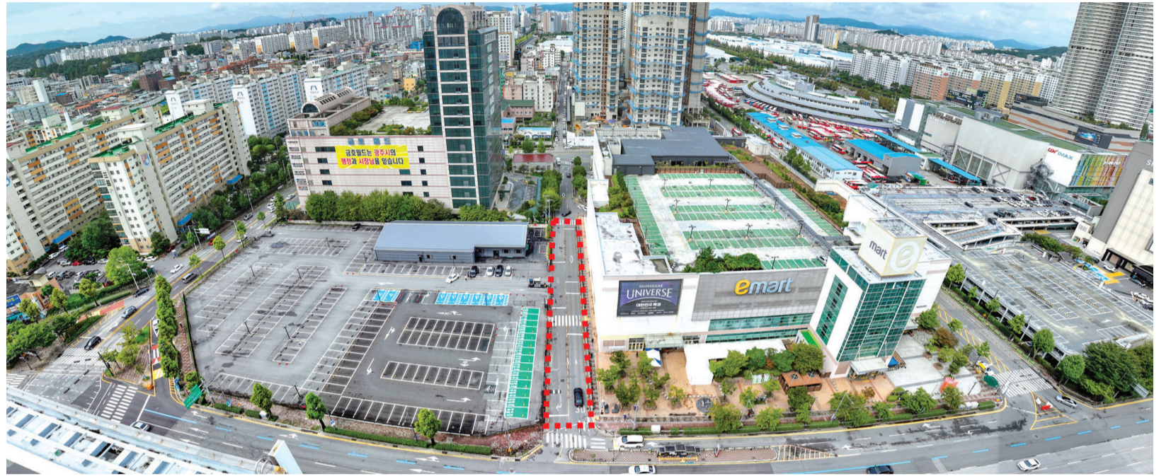
광주신세계가 확장을 추진 중인 광주시 서구 화동동 일대 전경. 광주신세계가 구상 중인 '신세계 아트 앤 컬처 파크'의 핵심은 이마트 광주점과 신관 야외 주차장 사이 8m 도로(붉은색 점선)를 없애고 두 부지를 합쳐 짓는 것인데, 광주시가 금호월드 상인 등의 민원제기를 이유로 제동을 걸고 나서면서 확장 계획에 비상이 걸렸다.