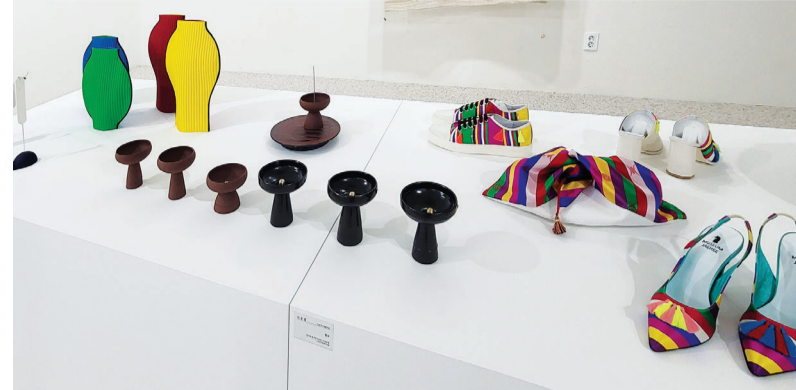
11월7일까지 미로센터에서 열리는 '순수의 결합, 공예·인연을 만나다' 전.

"개개인의 경험이 하나의 문화를 형성한다고 생각합니다. 그 경험을 만드는 게 예술가들의 역할이 고요. 전통을 계승하고 그 위에 또 다른 시각을 입혀 가는 게 MZ 세대들입니다. 이번 전시가 새로운 결혼 모델을 제시하는 기회가 되면 좋겠네요. 결혼은 새로운 출발을 축하하기 위해 지인들이 벌이는 행사예요. 공예품이 어우러진 행사에 모인 사람들이