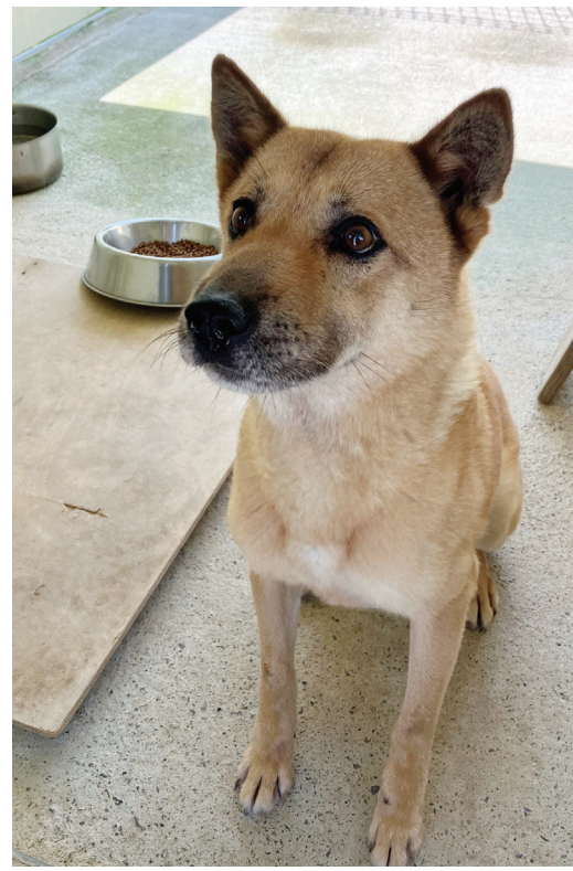
진도군에 살고 있는 토종 진돗개 '자연이'가 전남 1호 '착한펫'이 됐다. '착한펫'은 반려동물 이름으로 기부를 실천하는 사랑의열매 정기기부 프로그램이다.

다. 진돗개동호회에서 자연이가 가장 많은 사랑을 받고 있다고 소문이 날 정도다. 보호자 K씨는 "제가 자연이를 사랑하는 것처럼 다른 반려인들도 마찬가지로 거라 생각한다"며 "착한펫은 반려동물과 함께 살기 좋은 사회를 만드는 데 기여한다는 점에서 더욱 의미가 있으니 많은 분들이 관심을 갖고 적극적으로 참여해주셨으면 한다"고 전했다. 전남사랑의열매 관계자는 "반려동물 문화가 확산되고 있는 만큼 그와 관련된 사회문제가 발생하고 있다"며 "착한펫 프로그램이 동물학대·유기·협오 등 문제를 해결하고 반려동물 문화에 대한 긍정적인 인식 확산에 기여할 것으로 보인다"고 설명했다. 착한펫을 통해 모인 성금은 취약계층과 반려동물을 위한 지원사업에 쓰인다. 사랑의열매는 취약계층에게 반려동물 양육비·치료비를 제공하고 반려동물관리사자격증 등 유망직종에 취업해 자립할 수 있도록 지원할 예정이다. 기부금 내역은 국제청 연말정산간소화서비스를 통해 확인할 수 있으며 평균 2.2%까지 세제혜택을 받을 수 있다. 가입 문의는 전남 사랑의열매(061-902-6800)로 하면 된다. /이유빈 기자 lyb54@kwangju.co.kr