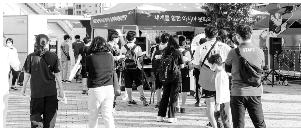
지난해 펼쳐진 'ACC DAY' 장면.