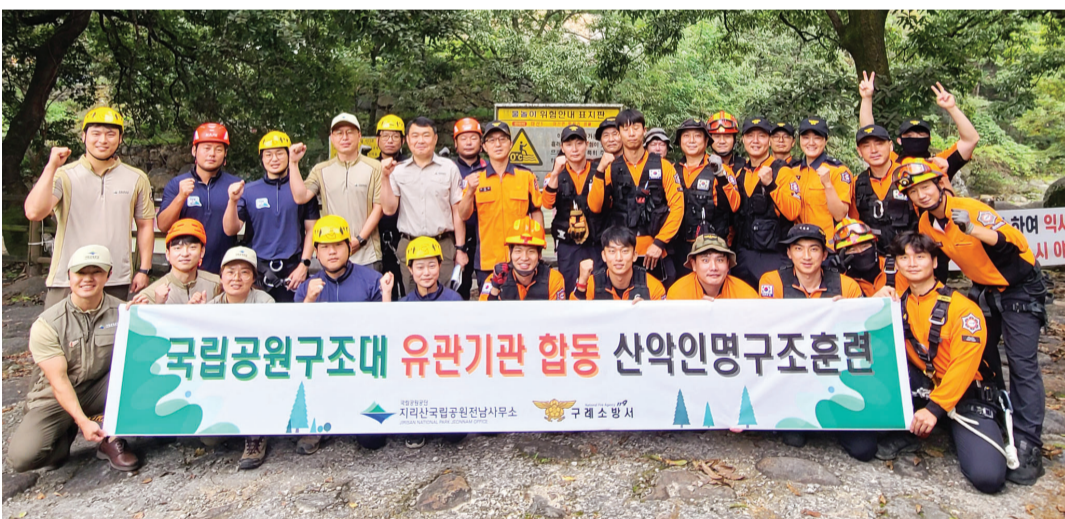
국립공원공단 지리산국립공원전남사무소는 최근 구례소방서와 함께 가을철 탐방객 안전관리를 위한 산악인명구조훈련을 실시했다.