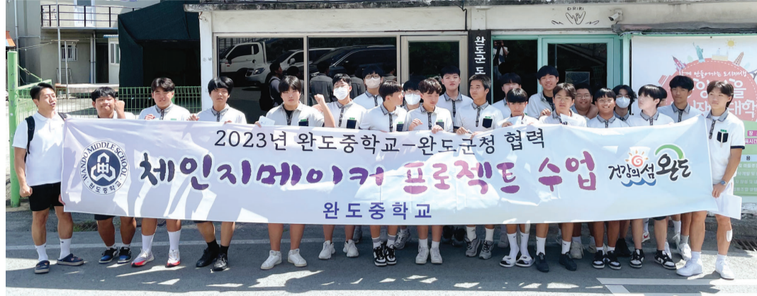
완도중학교는 학생들이 직접 지역현안을 연구하고 해결방안과 정책을 기획하는 ‘체인지메이커’ 수업을 진행하고 있다.

아이들은 학교에서 배운 지식을 활용해 공동체가 더 나아질 수 있도록 고민하는 과정에서 지역발전은 모두가 함께 만들어가는 것이라고 인식하게 됐다. 나아가 자신이 하고자 하는 지역을 위한 정책을 기획하면서 낙후된 지역, 시골이라는 인식에서 벗어나 지역에 대한 자긍심을 갖게 됐다고 입을 모았다.