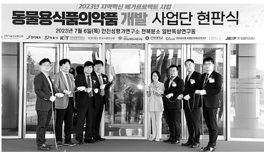
정읍시가 반려동물산업 클러스터 조성사업에 속도를 내고 있다. 지난 7월 열린 동물신약개발사업단 출범식.

시는 사업추진 초기임에도 불구하고 반려동물 신약개발사업단 '반려동물의약품 개발 및 실용화 플랫폼 구축(240억원)' 사업에 이어 지난 4월 '농생명소재 기반 반려동물신약 및 기능성사료개발 메가프로젝트(71억원)' 공모 선정으로 사업추진