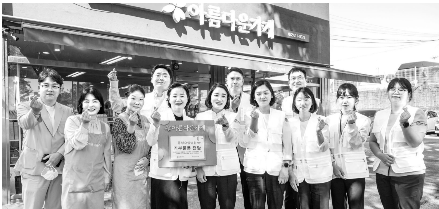
광주 북구 동행재활요양병원 임직원들이 11일 오전 아름다운 가게 광주역점에 물품 전달식을 갖고 기념사진을 찍고 있다.

한편 동행재활요양병원은 광주 북구 일성회 복지원사실 '건강마음돌봄지원서비스' 일환으로 지역 복지센터를 방문해 지역 어르신과 취