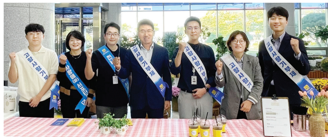
전남도는 12일 광주시 광산구 정부광주지방합동청사를 방문, 전남도 고향사랑기부제와 사랑애(愛) 서포터즈를 소개하고 참여하는 방안 등을 홍보했다.