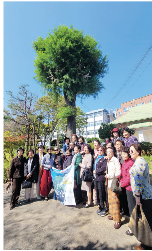
11일 열린 수피아여고 낙우송 식수 60주년 기념 행사에서 포즈를 취한 13회 졸업생들.

선배들의 아름다운 전통은 후배들에게 고스란히 이어졌다. 수피아여고는 졸업 후 20년이 되는 해를 맞는 기수가 주최자가 돼 매년 5월 10일 전후로 주말 흙커밋데이를 개최하고 있다. ‘살에 지치고 외롭고 또 서로가 그리울 때’ 우리의 안식처가 되는 로템나무 그늘이여라고 적힌 낙우송 앞 표지석처럼 60년간 계속된 우정과 사제 간의 정은 영원히 이어질 것이다. /글·사진=김미은 기자 mekim@