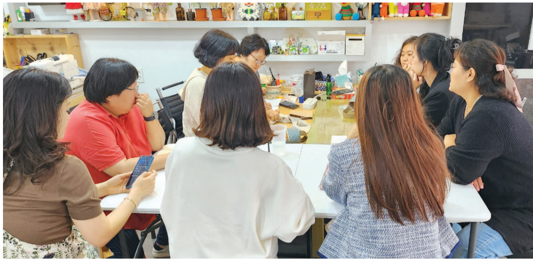
미얀마 여성 협동조합 솔루션(가명)이 지난 9일 남구 수페그린 협동조합에서 재봉틀 기술과 상품 제작과정에 대한 노하우를 전수받고 있다.