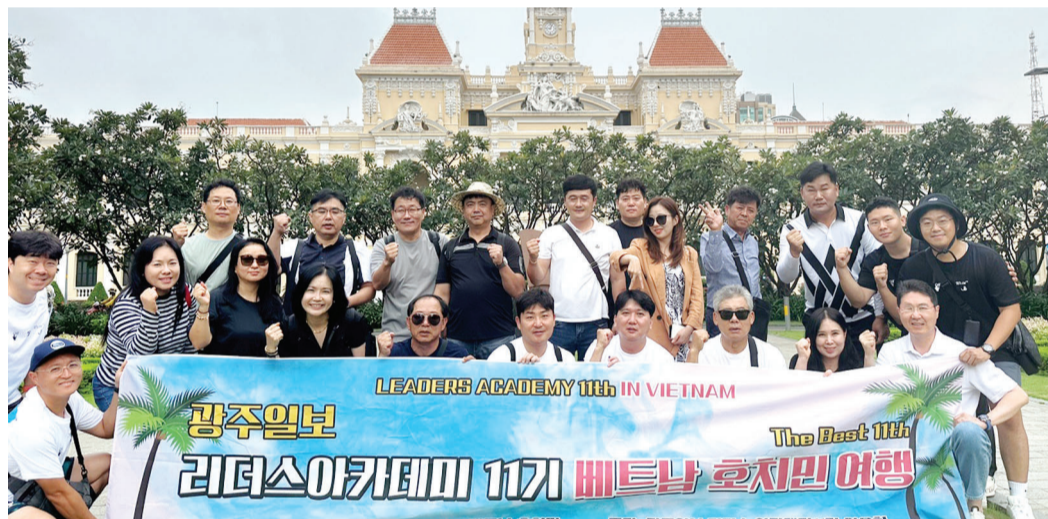
광주일보 리더스 아카데미 11기 원우들이 베트남 호치민 시티 인민위원회 청사를 배경으로 기념촬영을 하고 있다.