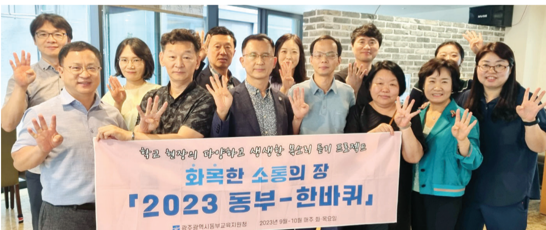
광주동부교육지원청(교육장 정성숙)은 최근 두달 간 학교별 현안을 청취하고 지원 방안을 논의하는 ‘화목한 소통의 장 2023 동부-한바퀴’ 프로젝트를 마쳤다.