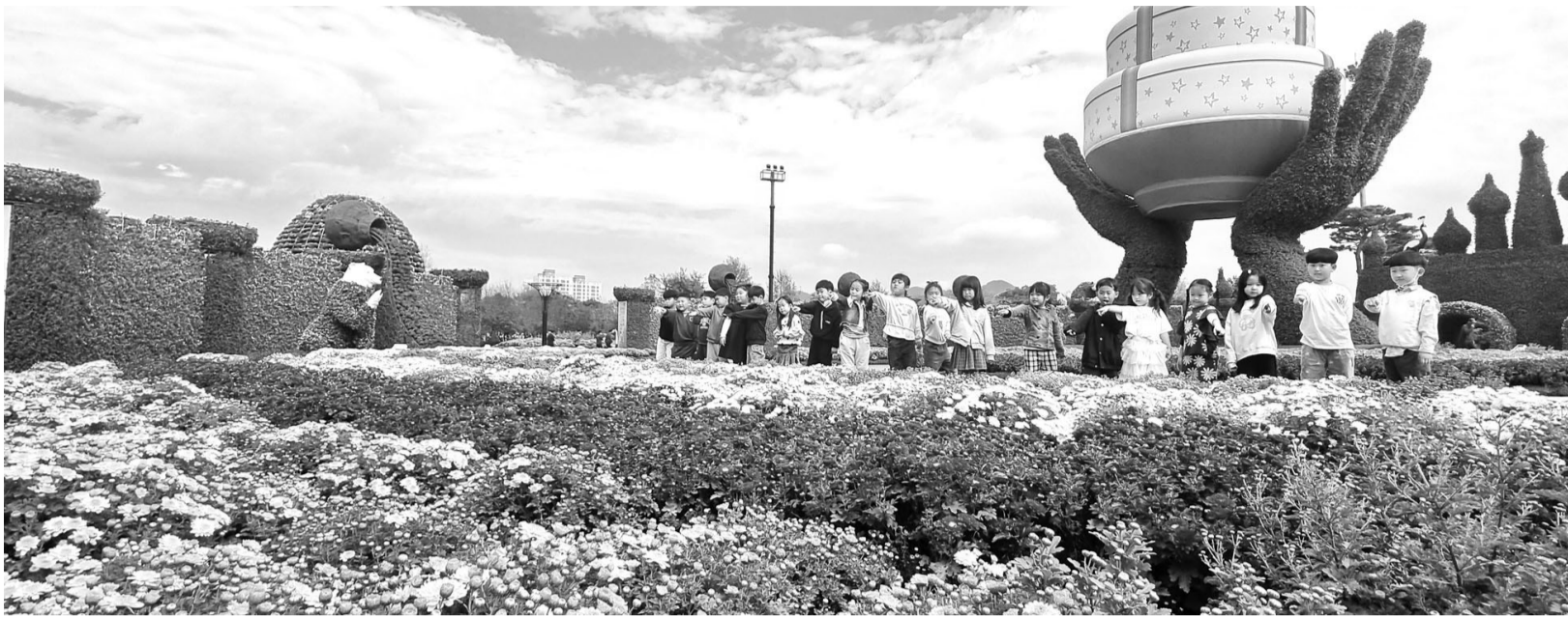
20일 개막하는 '2023 대한민국 국향대전'을 하루 앞둔 19일, 주 축제장인 함평엑스포공원을 찾은 어린이들이 형형색색 국화밭을 거닐고 있다.

함평군립미술관에서는 20일부터 12월10일까지 특별 기획전 '재현과 상상의 경계', '윤원식·흔적'이 열린다.