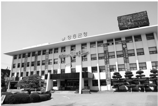
지난 1977년 지어진 뒤 46년간 이용해온 장흥군 현 청사.