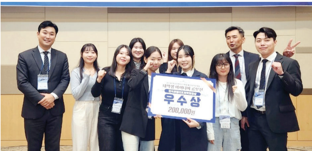
호남대학교 호텔경영학과 재학생들이 '2023년 한국관광트렌드 'MOMENT'와 광주시를 연계한 관광인프라 조성 및 관광 상품 아이디어 제안 공모전'에서 우수상과 장려상을 수상했다.