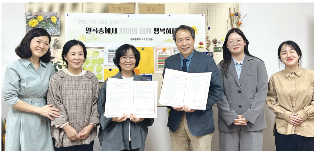
광주여자대학교(총장 이선재) 상담심리학과는 최근 월곡중학교와 다문화 미술치료 프로그램 및 맞춤형 사업 지원 등을 위한 업무협약을 체결했다.