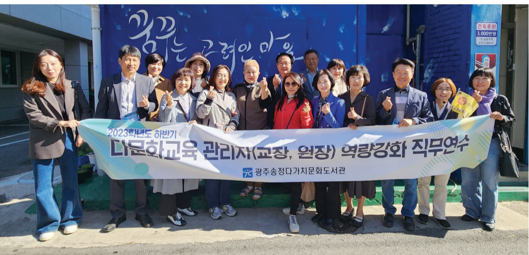
광주송정다가치문화도서관이 지난 16~18일 관내 교·원장 14명을 대상으로 다문화교육 관리자 역량강화를 위한 직무연수를 실시했다.