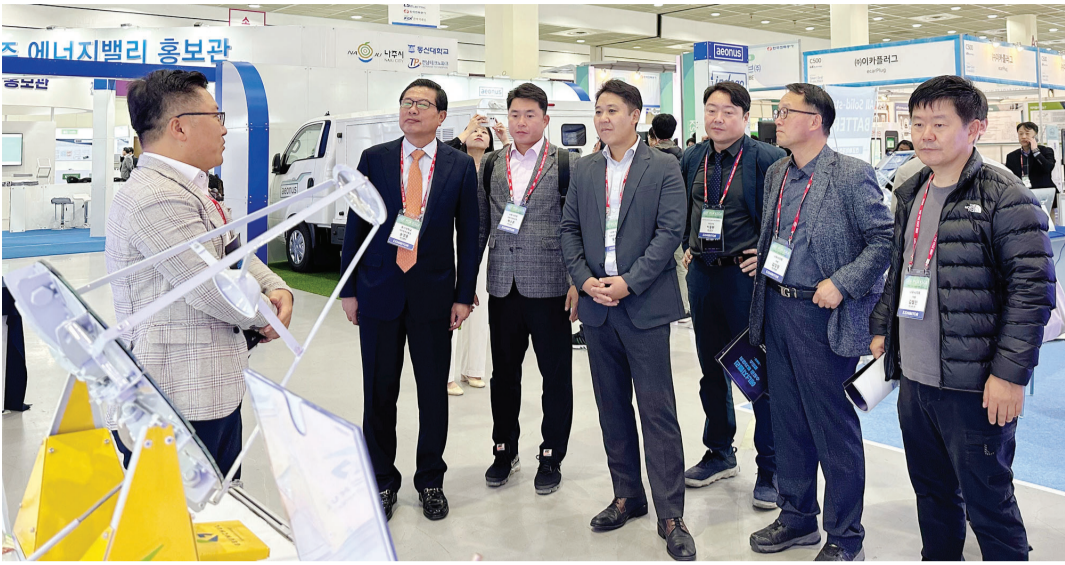
동신대 메이커스페이스사업단과 동신대 RIS사업단, 나주시, 전남테크노파크(이하 전남TP)는 19일 서울 코엑스에서 '에너지밸리 수도권 투자 유치 로드쇼'를 열었다.