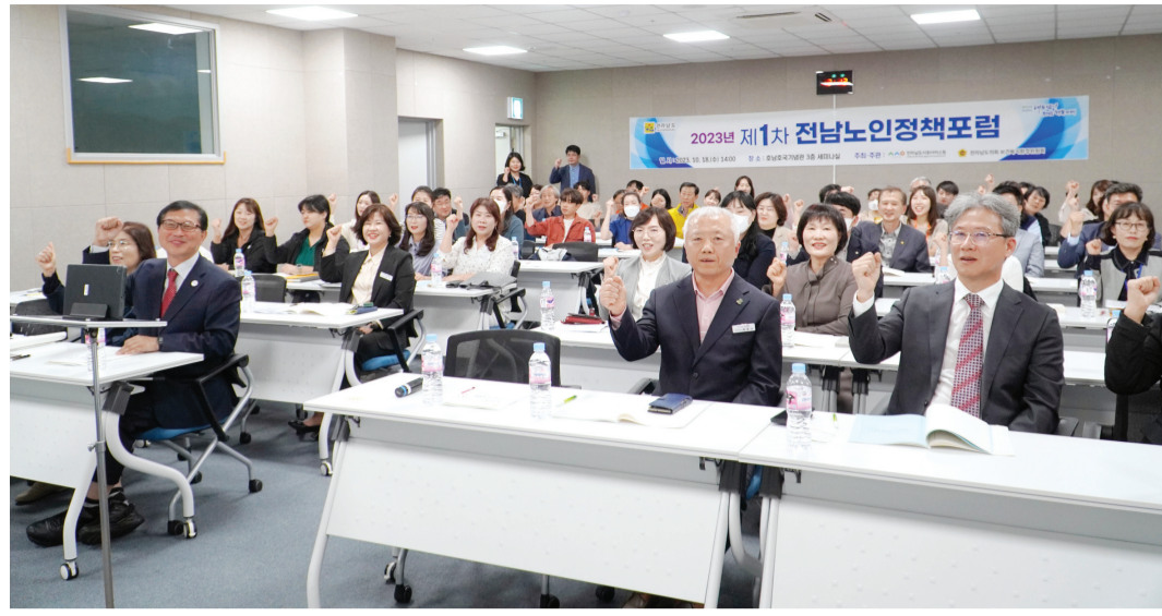
(재)전남도사회서비스원과 전남도의회 보건복지환경위원회가 지난 18일 순천 호남호국기념관에서 '2023년 제1차 전남노인정책포럼'을 개최했다.