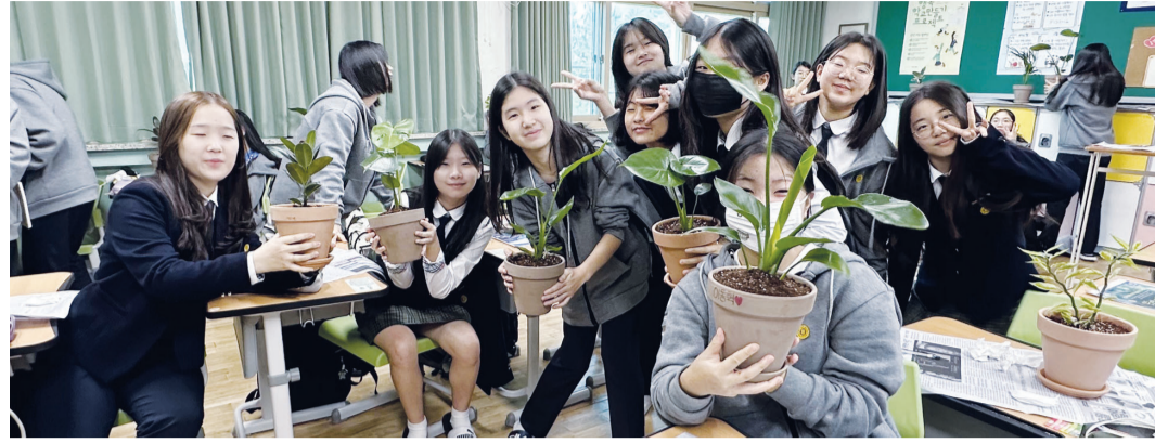
동아여자중학교 학생들은 지난 17일 열린 탄소중립데이 교내행사에서 반려식물을 직접 고르고 화분에 심는 '그린 클래스 만들기' 활동을 했다.

동아여중은 이외에도 양말목업사이클링(기술과정), 멸종위기 동물뱃지 만들기(과학), 교내 소정