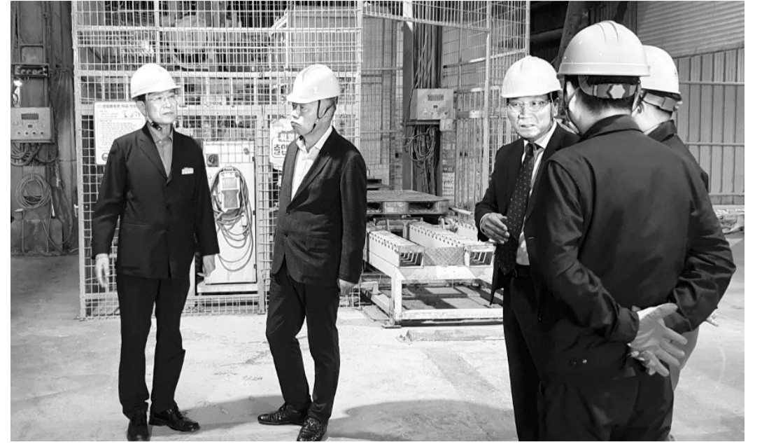
지난 25일 농협 전남검사국 관계자들이 광주축산농협 대불배합사료분부를 방문해 시설물 안전점검을 실시하고 있다.