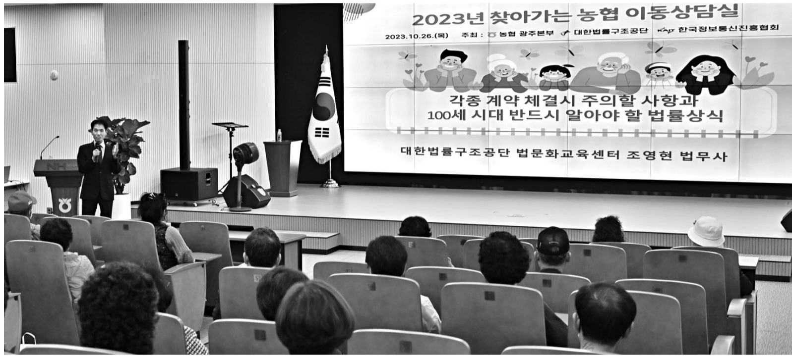
26일 북광주농협 대회의실에서 열린 '찾아가는 농협 이동상담실'에서 대한법률구조공단 강사가 농업인들에게 생활법을 강의를 진행하고 있다.