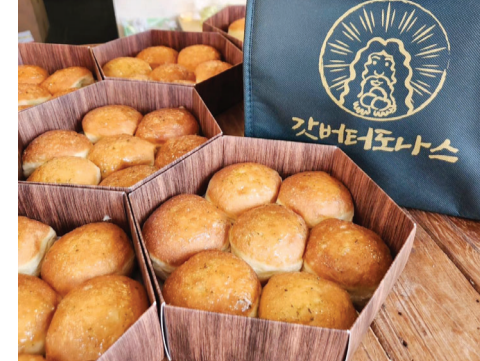
여수 돌산 갓으로 만든 ‘갓버터도나스’.

하면서 지역과 소비자가 무엇을 필요로 하는지 파악하는 게 중요하다는 것을 깨달았습니다.”