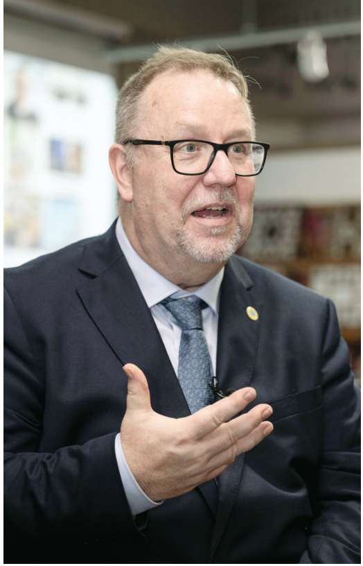
광주서 강연한 올레 토렐 스웨덴 국회의원.

“어머니가 진보적인 분이셨고 저를 페미니스트인 사람으로 키우려 하셨습니다. 나이가 많이 들어서 아들을 낳았기 때문에 최대한 많은 시간을 보내고 싶었습니다. 딱 한 번의 기회니까요. 스웨덴은 전 세계에서 가장 아바 육아휴직이 잘 돼 있는 나라라