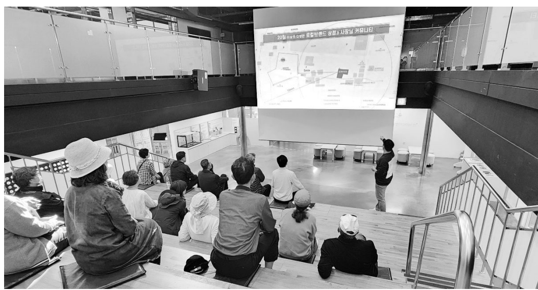
구례군 신활력플러스 추진단 30여 명이 최근 1박 2일 일정으로 충북 충주시·증평군·제천시 치유농업관광 선진지를 살펴봤다.