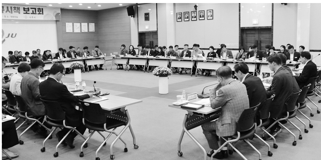
나주시가 최근 시청사 대회의실에서 2024년도 신규 시책 보고회를 열고 78건의 신규시책을 발굴·공유했다.