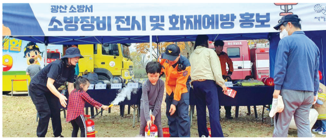
광주 광산소방서는 ‘제1회 광산시민안전체험한마당’에 참가해 화재진압 및 구조장비 전시, 방화복 착용 체험, 화재예방 홍보, 이동안전체험차량 탑승 등 홍보·체험 부스를 운영했다.