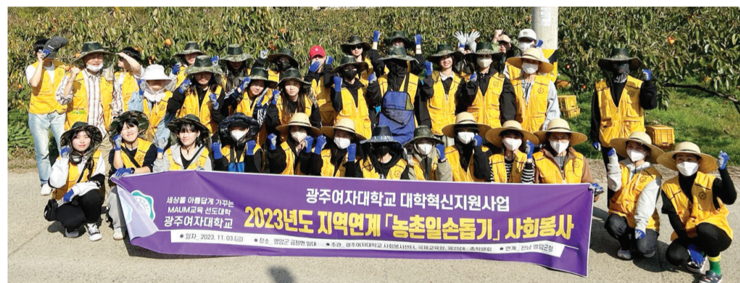
광주여자대학교(총장 이선재) 사회봉사센터는 지난 3일 영암군청과 협력해 농촌 일손 돕기 봉사활동을 실시했다. 이번 봉사활동은 지역사회에 봉사하며 마음나눔을 실천하기 위해 기획됐다.