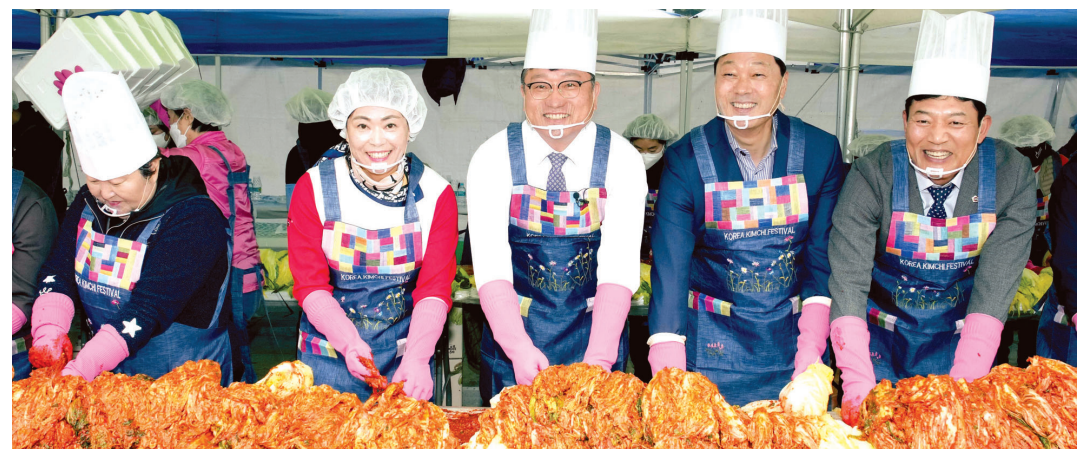
한국여성농업인 전남도연합회는 7일 명창환 전남도 행정부지사, 서동욱 전남도의회 의장 등 100여명이 참가한 가운데 '김장김치 담그기 및 김장나눔 행사'를 개최했다.