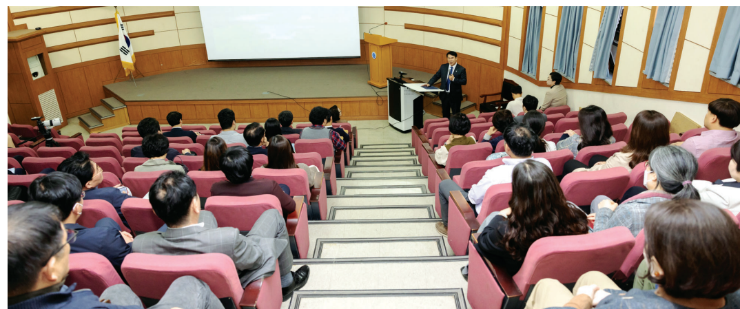
동강대학교(총장 이민숙)는 최근 학교 보건관 2층 율곡홀에서 이정선 광주시교육감을 초청해 '변화, 성장과 발전의 원동력'을 주제로 특강을 진행했다.