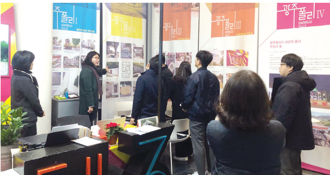
(재)광주비엔날레와 광주시가 추진하는 광주폴리의 벤치마킹을 위해 서울시청 도시경관담당관 직원 등 10여 명이 16일 광주를 방문해 국립아시아문화전당 인근 광주폴리를 한 시간 기량 둘러봤다.