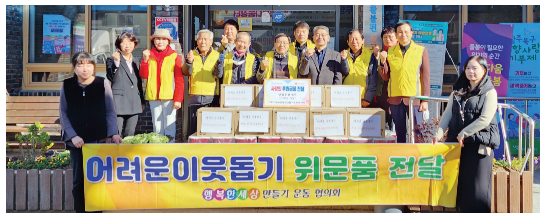
행복한 세상만들기 운동 협의회는 20일 광주시 두암1동사무소를 찾아 취약계층 10가구에 라면과 화장지를 전달했다. 협의회는 5·18국립묘지와 민족민주열사묘지 비석뒤편 등 다양한 봉사활동을 진행하고 있다.