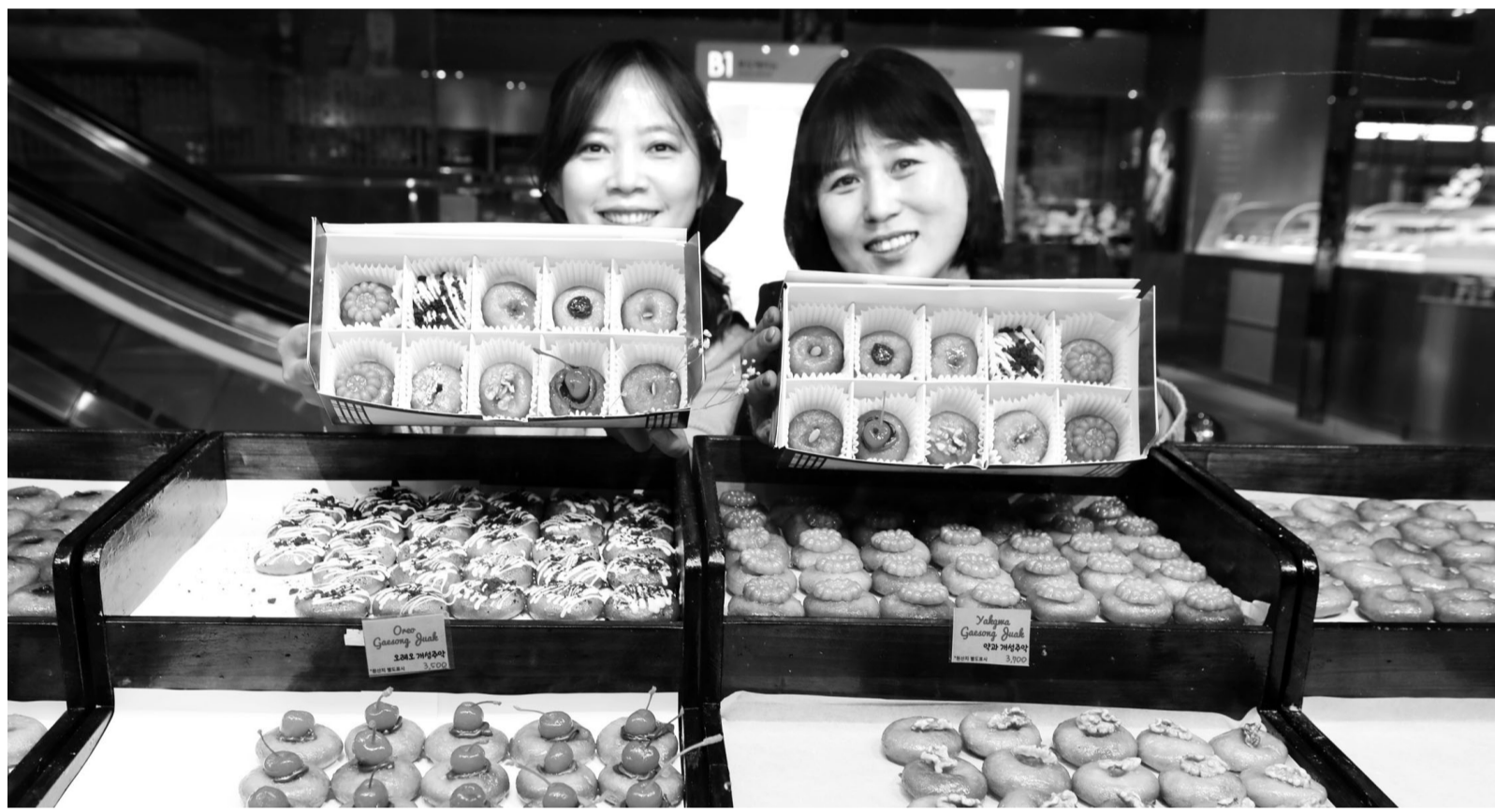
"전통 디저트 '개성주약' 맛보세요" 롯데백화점 광주점 직원들이 전통 한식 디저트 브랜드로 유명한 '개성주약' 제품을 선보이고 있다. 개성주약은 찹쌀가루와 밀가루를 막걸리로 반죽해 기름에 지져낸 전통 한식 디저트로, 과거 귀한 손님에게 대접하던 고급음식이다. 광주점은 오는 30일까지 개성주약 팝업스토어를 운영하며 라즈베리·누텔라·약과 개성주약 등 다양한 종류의 개성주약을 만날 수 있다.

청년 세대의 53.8% (549만1000명)는 수도권에 거주했다. 청년 세대의 수도권 거주 비중은 2005년 51.7%로 올라선 이후 과반을 유지하고 있다. 2020년 출생지를 떠나 다른 권역으로 이동한 청년은 수도권에서 46만2000명, 중부권에서 41만 8000명, 호남권에서 42만7000명, 영남권에서 67만5000명이었다. 중부권에서 83.1%, 호남권에서 74.5%, 영남권에서 75.9%가 각각 수도권으로 이동했다. 비수도권에서 이동한 청년(152만명) 중 77% (117만 8000명)가량이 수도권으로 이동한 셈이다. 무엇보다 고령화와 인구유출 문제가 심각한 호남권(광주·전남·전북·제주)은 청년비중이 9.9%로 대전 충남 등을 포함한 중부권(13.5%)보다 3.6%포인트 적었다. 수도권이 53.8%로 가장 많았고, 영남이 22.8%였다. /장윤영 기자 zzang@kwangju.co.kr