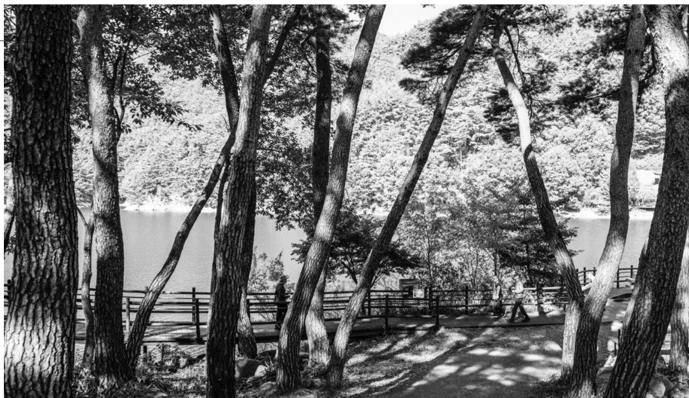
물을 옆에 끼고 소나무 숲을 호젓하게 걸을 수 있는 천은사 '상생의 길'.