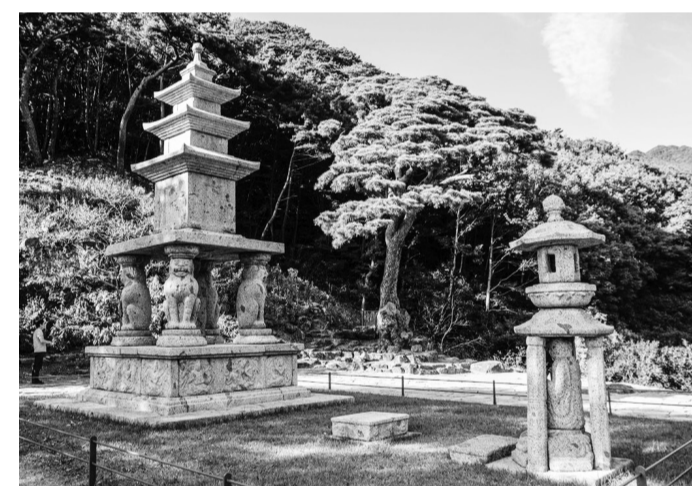
'효대(孝臺)'에 자리하고 있는 '화엄사 4사자 삼층석탑'.

◇대목장 마음와 달는 구충암 모과나무 기둥=화엄사 대웅전에서 구충암으로 가는 오솔길은 호젓하다. 암자에 들어서면 노거수 동백나무와 석탑이 여행객을 맞는다. 석탑을 지나면 정면에 천불보전이, 좌우에 요사채가 자리하고 있다. 왼쪽 요사채는 길이란 맞춘 자연연대로의 모과나무 몸체로 기둥을 삼았다. 한쪽은 나무를 제대로, 다른 한쪽은 나무를 거꾸로 세웠다. 맞은편 요사채 기둥 하나도 다듬지 않은 나무 그대로다. 이렇게 파격적으로 기둥을 세워 집을 지은 대목장(大木匠)은 어떤 이일까? 요사채에 걸린 '다향사류'(茶香四流)차 향기가 사방에 흐른다) 현판은 구충암의 오랜 야생차 역사를 대변해준다.