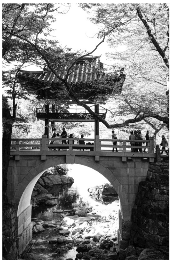
드라마 '미스터 션샤인'에 등장한 천은사 수홍루.

자연 통해 배우는 천은사 '상생의 길' '미스터 션샤인' 배경 수홍루 보고 구충암 오솔길 따라 호젓한 산행 붉디붉은 피아골의 역사 느끼고 '지리산 스카이 런' 짜릿한 체험도