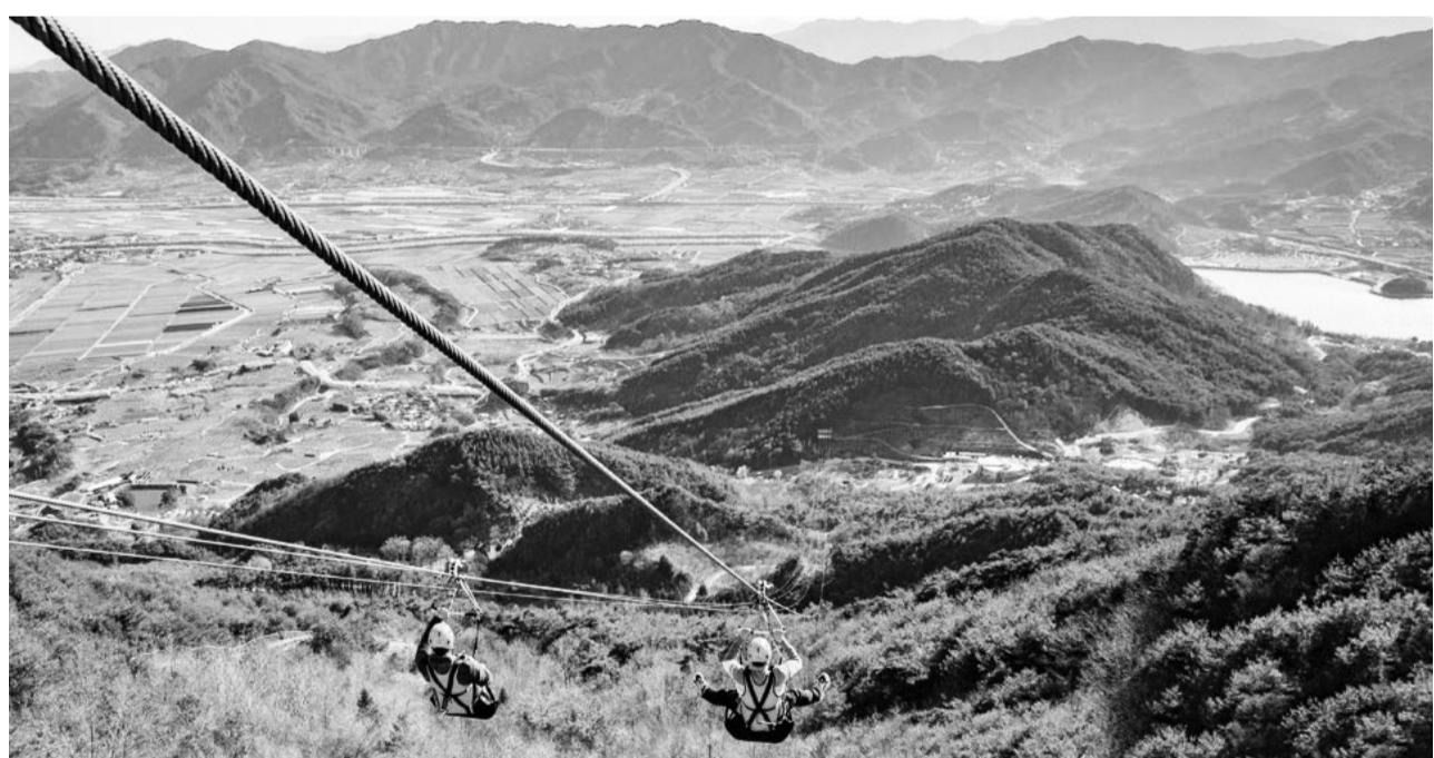
하늘을 나는 짜릿함을 만끽할 수 있는 '지리산 스카이 런' 짙 와이어.

"보기만 해도 즐겁고 미소가 지어지는 '동양의 산타할아버지'로 불리우는 포대화상을 보면서 지치고 힘든 시절 마음 안으로 가득한 웃음 가져가시길 두 손 모아 발원합니다."