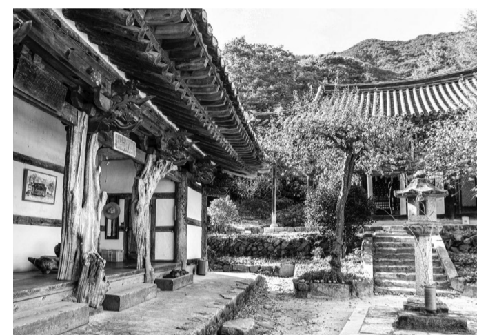
모과나무의 자연미를 살린 '구충암 모과나무 기둥과 석등'.