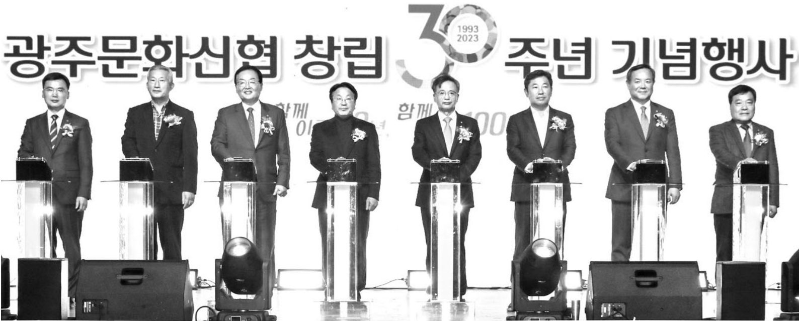
지난 27일 광주문화신탁 창립 30주년 기념식에 참가한 내빈들이 기념촬영을 갖고 있다.

기초연금 전체 수급률은 66.4%, 전체 평균 수급액은 25.2만원이었지만, 1인 가구의 수급률은 77.6%, 수급액은 28.2만원에 달했다. 특히 여성(79.9%), 농어촌(85.2%) 가구의 기초연금 수급률이 높았다. 1인 가구의 자산 수준은 소득보다 더 낮았다. 1인 가구 중 소득 1분위(하위 20%) 비율은 18.6%였지만, 자산 1분위 비율은 43.6%에 달했다. 이는 부동산 등 자산 축적을 아직 하지 못한 청년층 1인 가구 등이 많은 영향으로 분석된다. 1인 가구는 전체 평균보다 국민연금 가입률이 더 높았지만, 수급액은 높지 않은 수준이었다. 특히 1인 여성과 75세 이상 가구의 연금 수준이 저조했다. /연합뉴스