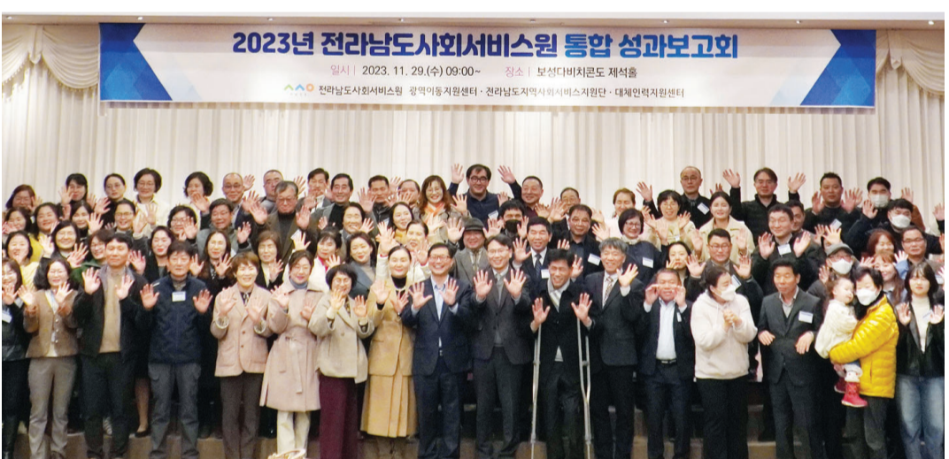
전남도사회서비스원이 주최한 '2023 전남도사회서비스원 통합 성과보고회'가 지난 29일 보성대비치콘도에서 열렸다. 이날 보고회에는 광역이동지원센터, 지역사회서비스지원단, 사회복지대체인력지원센터의 통합에 따른 우수사례에 대한 시상식을 겸해 개최했다.