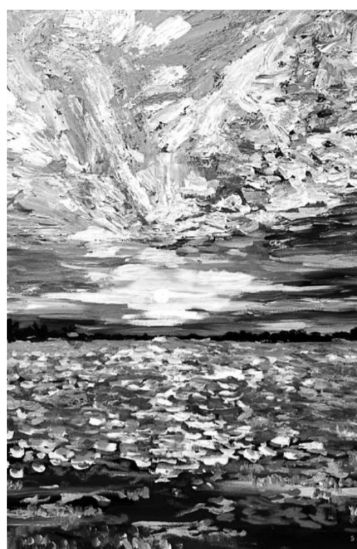
싱가포르 레옹 시온 작품