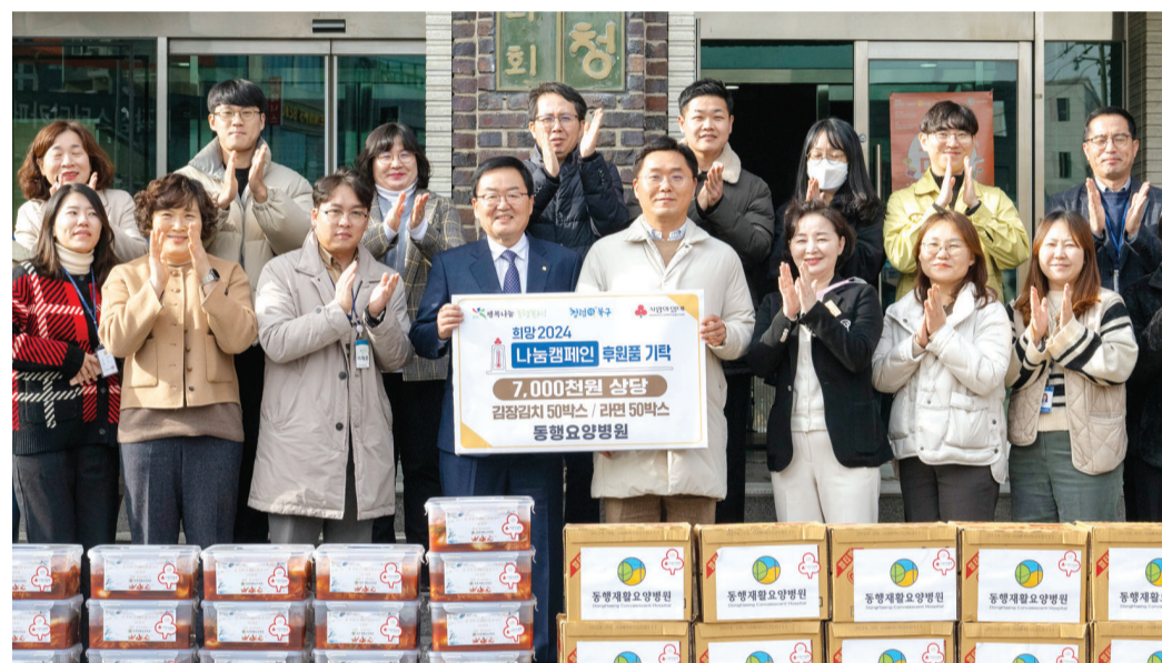
동행재활요양병원은 4일 ‘희망 2023 나눔 캠페인 물품 기탁식’을 열고 광주 북구청에 700만 원 상당의 김장김치와 라면을 전달했다.