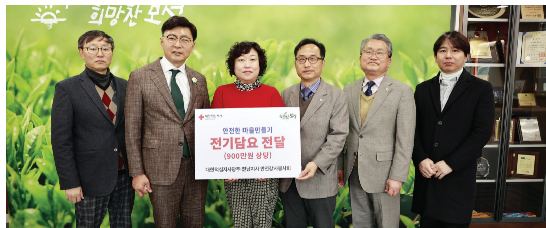
대한적십자사 광주전남지사(회장 허정) 소속 안전강사봉사회는 4일 보성군 취약계층에 900만 원 상당의 전기담요 210개를 전달했다.