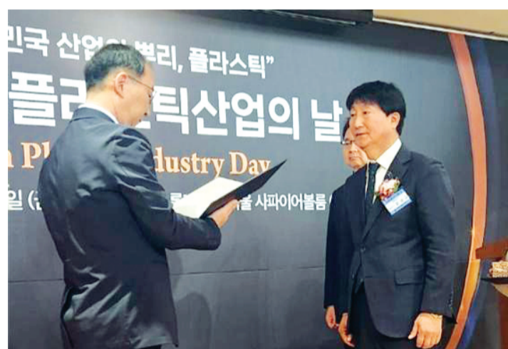
회사로 거듭나겠다”며 “품질 개량과 신기술 개발로 수출 다각화를 위해 노력할 것”이라고 밝혔다.