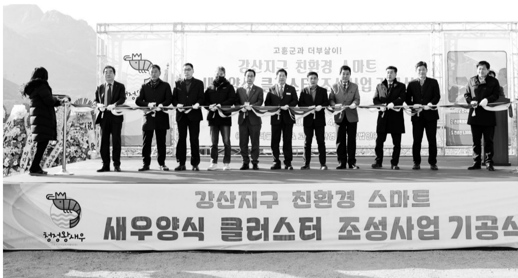
고흥군이 점암면 강산지구에서 개최한 '친환경 새우양식 집적단지' 조성사업 기공식에서 참석자들이 기념 촬영을 하고 있다.

고흥군 점암면 강산지구에 '친환경 새우양식 집적단지'가 조성된다. 고흥군은 최근 고흥수산업협회사법인(주), 지엠디글로벌, 귀어인 300여 명이 참석한 가운데 기공식을 열었다. 점암면 강산지구 친환경 새우양식 집적단지(클러스터)는 앞서 올해 3월 도덕면 가야리에 조성한 친환경 새우 양식단지의 13배에 달하는 49만 5868㎡(15만평) 규모로 조성된다. 고흥수산업협회사법인과 민간 투자사 지엠디글로벌이 1000억원을 투자해 조성 사업이 추진된다. 이곳에는 양식장과 종묘장, 사료공장, 유통시설, 교육·연구센터, 양식 기자재(모듈) 생산시설 등이 들어선다. 종묘부터 출하까지 한 번에 처리하는 양식 체계를 구축할 예정이다. 한편 도덕면 가야리 일원에는 친환경 새우양식 단지가 지난해 착공해 올해 3월 준공했다. 민간 투자금 80억원을 투입해 8만2644㎡(2만 5000평) 규모로 조성됐다. 이곳에는 귀어인 19가구가 입주해 새우 양식을 하고 있다.