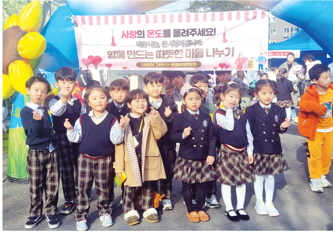
지난 8일 광주시 동구 용산동의 ‘애플B 나눔행사’ 행사장에서 애플B유치원 원아들이 포즈를 취하고 있다.