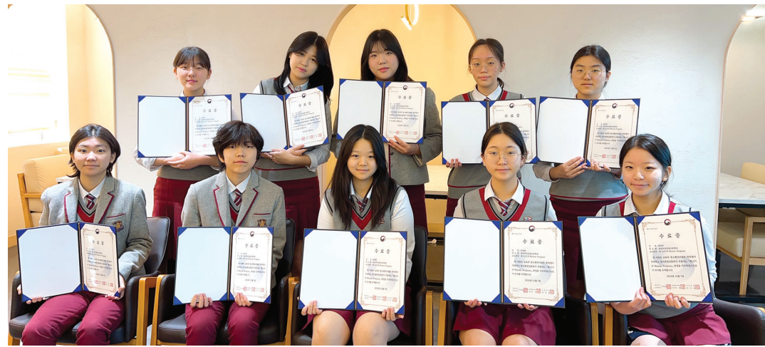
전남여자상업고등학교는 최근 ‘제13기 IP Meister Program’에서 4건의 특허를 출원하고 한국발명진흥회장상 등을 수상했다.