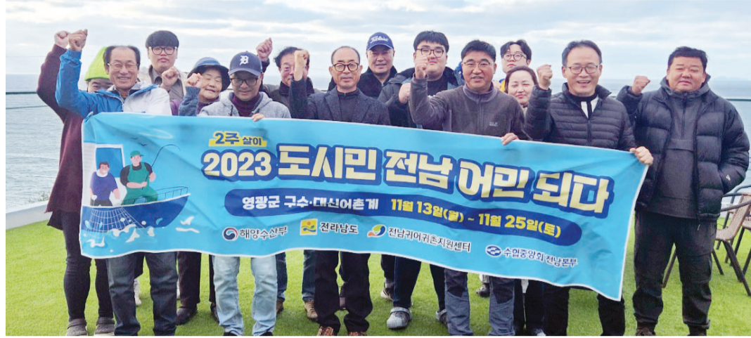
전남귀어귀촌지원센터가 운영하는 ‘도시민, 전남 어민되다’ 프로그램에 참여한 10명의 귀어 희망 도시민들이 영광 구수대신 마을에서 기념촬영을 하고 있다.

서울)씨는 “지역 특산물을 이용해 부가가치를 높이고 지역 특색을 살린 관광 프로그램을 구상해보는 등 새로운 가능성들을 확인할 수 있었다”며 “빈집을 찾을 수 없어 다소 어려움이 있지만, 먼저 혼자 내려와 어촌에 정착한 뒤 가족들을 합류시킬 생각”이라고 설명했다.